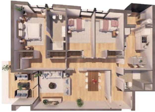
VIVIENDA A ESCALERA A