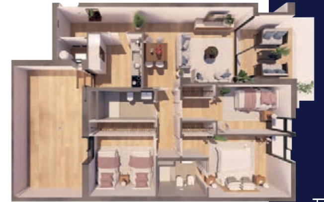
VIVIENDA D ESCALERA B