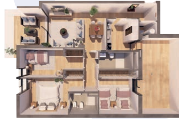
VIVIENDA A ESCALERA B