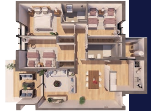
VIVIENDA B ESCALERA B