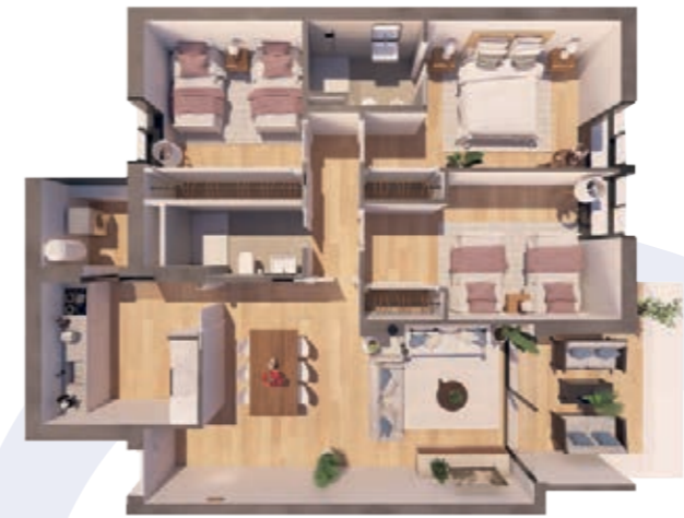
VIVIENDA C ESCALERA B