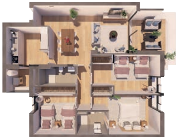
VIVIENDA C ESCALERA A