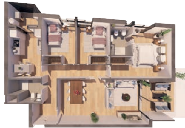
VIVIENDA D ESCALERA A