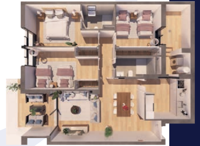
VIVIENDA B ESCALERA B