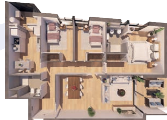
VIVIENDA D ESCALERA A