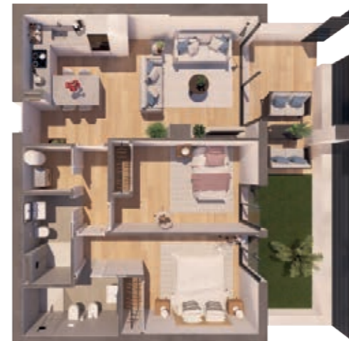
VIVIENDA C ESCALERA A+B 2 Dormitorios | 2 Baños | 1 Terraza