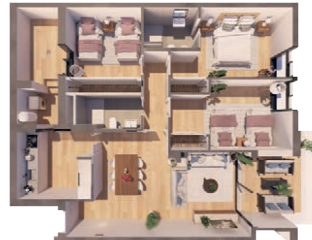
VIVIENDA C ESCALERA B