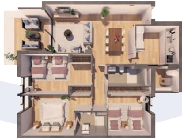
VIVIENDA B ESCALERA A