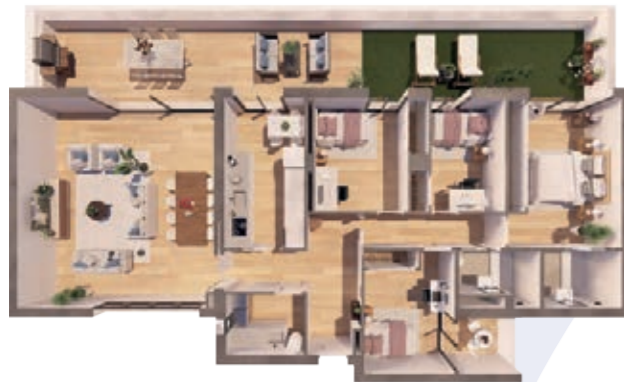
VIVIENDA A ESCALERA B 4 Dormitorios | 2 Baños | 2 Terrazas