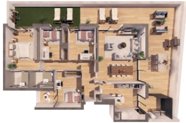
VIVIENDA A ESCALERA A 4 Dormitorios | 2 Baños | 2 Terrazas