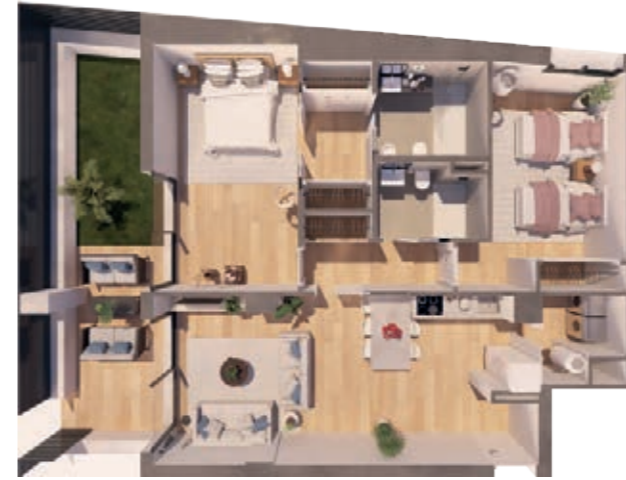
VIVIENDA A ESCALERA A+B 2 Dormitorios | 2 Baños | 1 Terraza