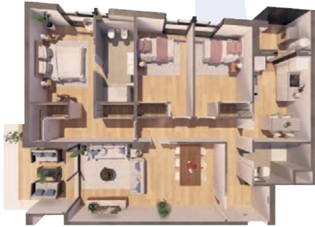
VIVIENDA A ESCALERA A