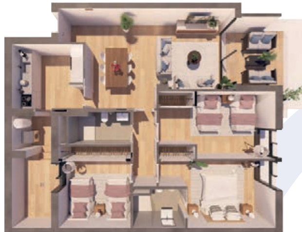
VIVIENDA C ESCALERA A