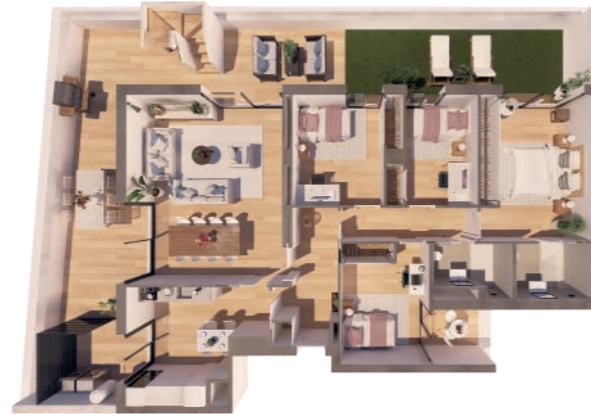
VIVIENDA B ESCALERA A 4 Dormitorios | 2 Baños | 3 Terrazas