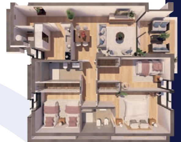
VIVIENDA D ESCALERA B