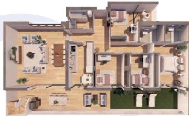
VIVIENDA B ESCALERA B 4 Dormitorios | 2 Baños | 3 Terrazas