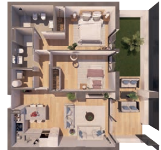
VIVIENDA D ESCALERA A+B 2 Dormitorios | 2 Baños | 1 Terraza