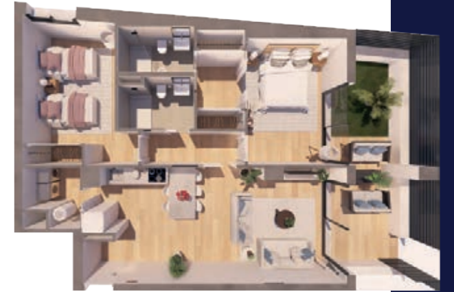
VIVIENDA B ESCALERA A+B 2 Dormitorios | 2 Baños | 1 Terraza