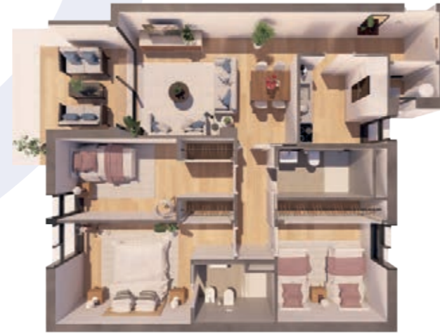
VIVIENDA A ESCALERA B